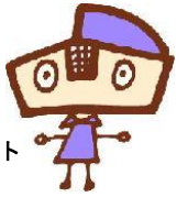
利彩館マスコット 「リプラちゃん」

場所 リサイクルプラザ利彩館 富士見市大字勝瀬480番地 ☎049(254)1160