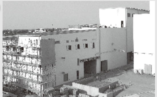
工事状況(平成26年9月)

富士見環境センターでは、平成27年1月の運転開始に向けて粗大ごみ・ビン処理施設建設工事を行っています。工事期間中、場内が大変狭くなっており、車両の出入りや粗大ごみの受入れに制限を設けています。引き続き、皆様のご理解ご協力をお願いします。