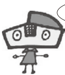
利彩館マスコット 「リプラちゃん」

測定結果は全て、国等の基準を下回っています。詳しくは組合ホームページをご覧ください。